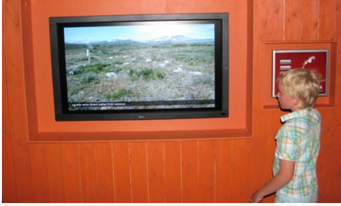
Bildevegg, med motiver blant annet fra Hjerkinn