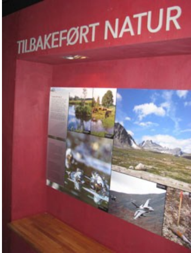
Tekst og foto: Trond Enemo Kilde: www.skogmus.no/