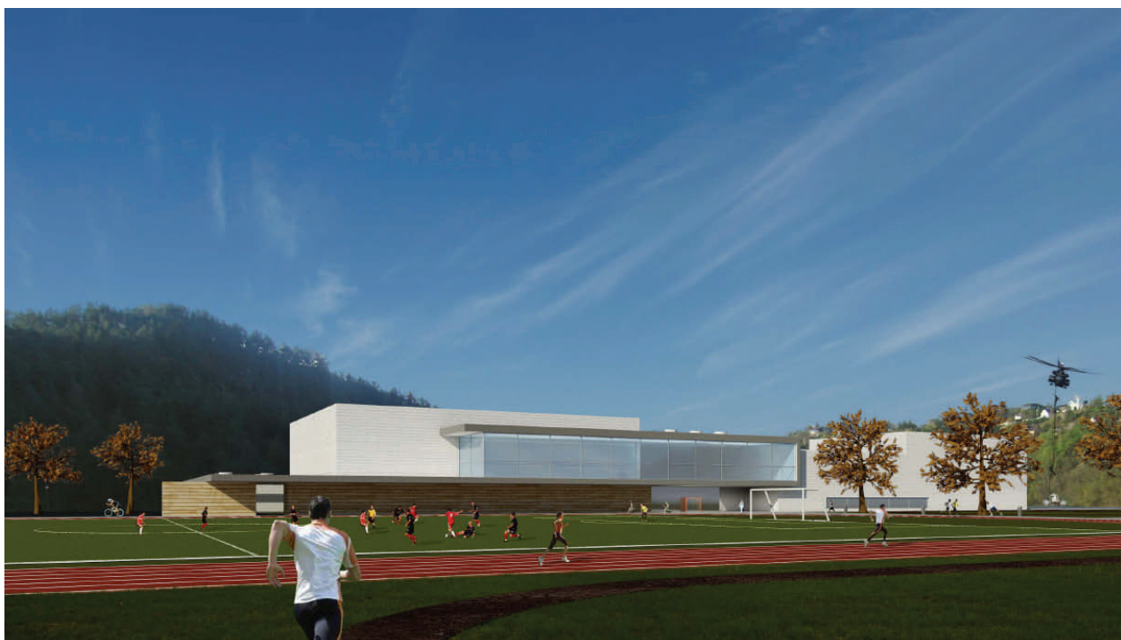
Nytt militært treningsanlegg på Haakonsværn. Illustrasjon: Longva arkitekter.

I august 2008 startet Forsvarsbygg Utvikling arbeidene med infrastrukturen og klargjøring av byggegruppen for prosjektet Nytt militært treningsanlegg (MTA) på Haakonsværn orlogsstasjon. Det nye militære treningsanlegget, som vil ha over 5000 brukere, skal sikre Forsvarets operative evne og legge til rette for trening og helse både i arbeid, utdanning og fritid.