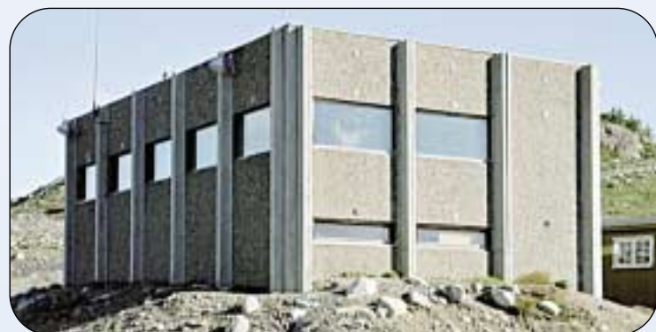
Skytelederhuset på Haukberget er eksempel på et bygg som det er greit å rive og fjerne fra Hjerkinn.

– Tilbakeføring i så stor målestokk som på Hjerkinn er meget sjelden. Her legges det opp til et tilbakeføringsarbeid som bør være svært interessant for mange å studere. Dette bør både Forsvaret og sivile myndigheter utnytte ved å tilrettelegge for at flest mulig kan høste erfaringer og dra nytte av arbeidet med tilbakeføring av Hjerkinn skytefelt til sivile formål, avslutter Peter A. Jacobsen, som synes det har vært både interessant og lærerikt å arbeide med denne utredningen.