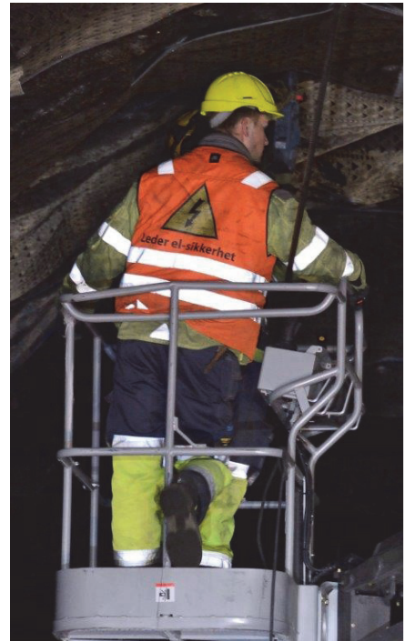
Beredskapsvakt høyspenning

Denne veilederen gir retningslinjer for rapportering i et prosjekt, men fritar ikke arbeidsgiver fra rapporteringsplikt til myndighetene (politi, Arbeidstilsyn, DSB, NAV mv).